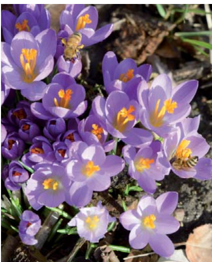
An sonnigen Wintertagen sind bereits die ersten Insekten auf Nahrungssuche.

Die ersten Blumen, die im Februar blühen, erfreuen uns und animieren uns zur Gartenarbeit. Für einen bunten Sommer müssen die ersten neuen Pflanzen ins Beet gebracht werden. Auch im Februar blühen Blumen die eine wichtige Aufgabe für Insekten wie zum Beispiel für die Erdhummel oder den Zitronenfalter haben. Ab Temperaturen von 4 °C sind diese bei den ersten Ausflügen nach der Winterruhe zu beobachten. Zu den Stauden und Blumen, die im Februar blühen, zählen unter anderen Christrosen, Schneeglöckchen, Narzissen, Primeln, Krokusse und Märzenbecher sowie weiterhin Gehölze wie Winterjasmin, Zaubernuss und Haselnuss. Aber auch das Aussäen und Einpflanzen ist im Februar nötig. Sommerblumen, die nur langsam wachsen, sollten wir an einem warmen Ort zum Vorziehen aussäen. Dazu gehören Löwenmäulchen, Nelke, Veilchen,