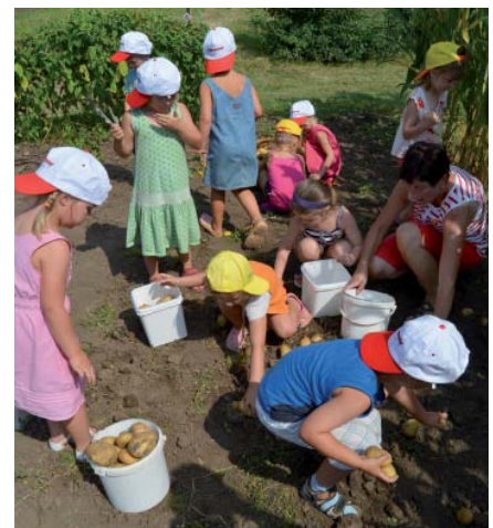
Kleingärten sind für Mädchen und Jungen nicht nur während der Erntezeit einzigartige Lern- und Erlebnisorte.

Bei der Vergabe von Kleingärten soll im Interesse der Erhaltung der Kleingartenanlage die Bewerbung von jungen Familien bevorzugt berücksichtigt werden, was sich in ländlichen Regionen auch positiv auf die Bevölkerungsstruktur auswirken kann.