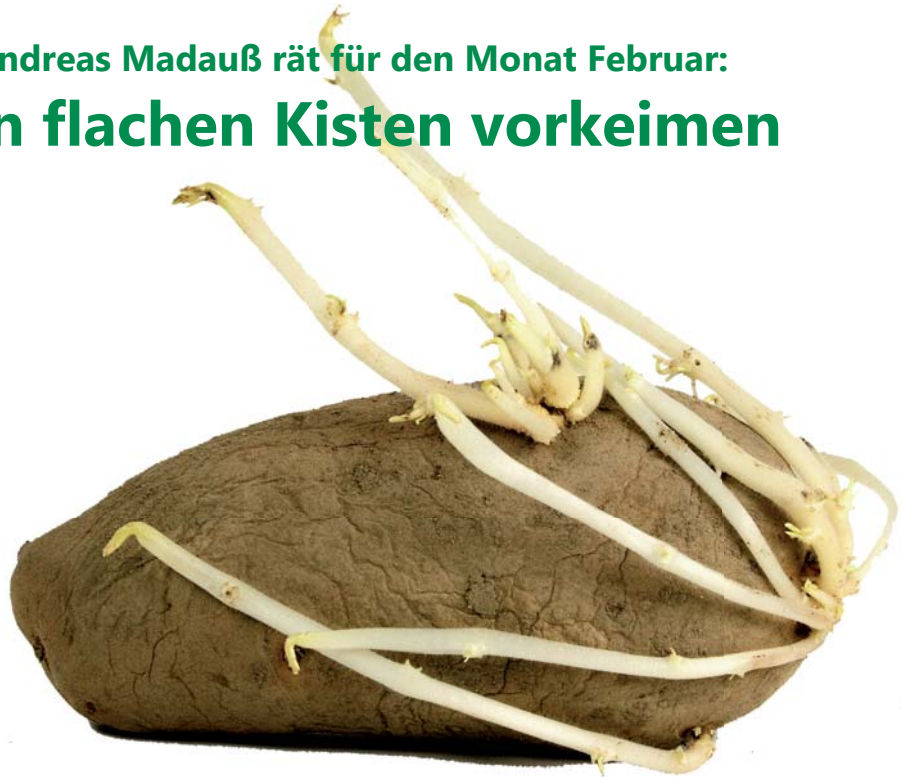
Gut gekeimt ist schon fast gut gewachsen. Pflanzkartoffeln können bereits im Februar in flachen Kisten, Eierverpackungen oder ähnlichem vorgekeimt werden.

Bartnelken, Pelargonien, Begonien, Vanilleblumen und Lobelien, die auf der Fensterbank vorgezogen werden. Aber selbst im Freiland können, wenn der Boden frostfrei ist, wurzelnackte Rosen oder Narzissen in die Erde gebracht werden.