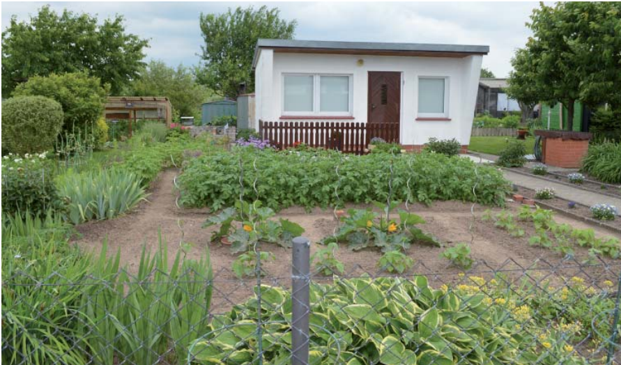
Gartenlauben aus DDR-Zeiten genießen Bestandsschutz und dürfen zum gelegentlichen Übernachten genutzt werden.