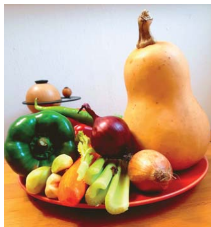
Diese Zutaten kommen in eine Kürbissuppe á la Karibik.

„Na das ist doch schon ein Anfang“, sagt Frau B. und steckt zufrieden ihr Schreibzeug weg.