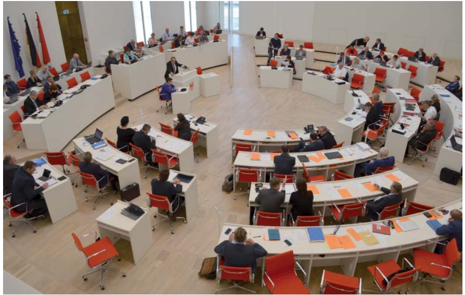
Auf Drängen des Landesverbandes und Anregung des Landeskleingartenbeirates haben sich die Abgeordneten des Landtages in der zurückliegenden Legislatur mindestens einmal im Jahr mit der weiteren Entwicklung des Kleingartenwesens beschäftigt.

Hier sorgen Kleingartenanlagen als Bestandteil des öffentlichen Grüns für die Verbesserung der klimatischen Bedingungen. Sie erfüllen wichtige Ausgleichsfunktionen in Bezug auf Klima, Temperatur, Luftfeuchtigkeit und haben durch den geringeren Grad der Versiegelung positive Aus-